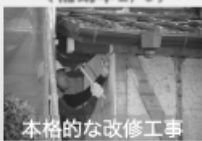
本格的な改修工事