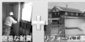
簡易な耐震 リフォーム工事