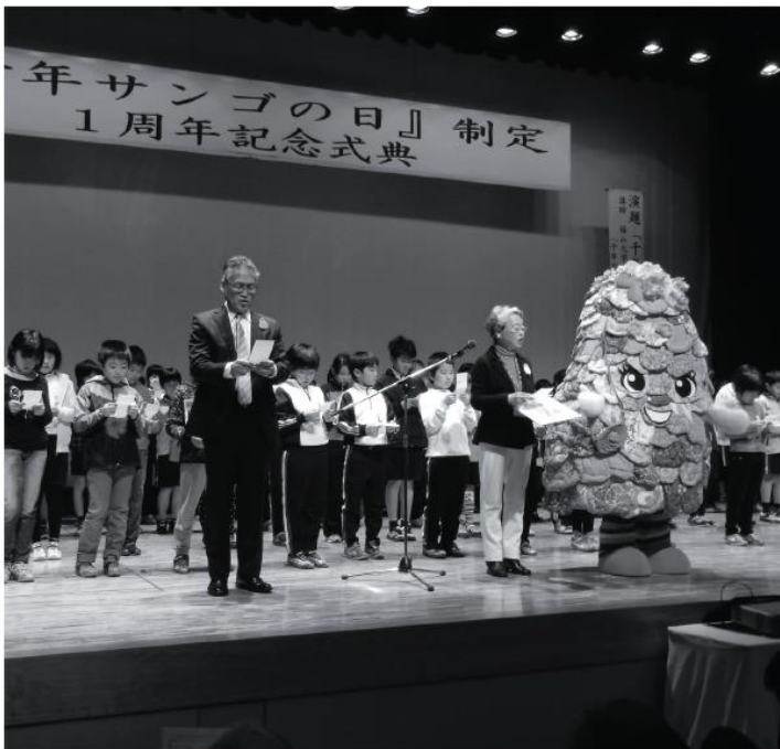
「千年サンゴの日」制定1周年記念式典（12月7日）

ることが不可欠である。県からも密漁に対する注意喚起情報があり、現時点では理解を得ることは難しいと考えている。 千年サンゴを見てもらうのであれば、保全活動に参加してもらえないが、逆に希少性に訴えて、さらなる観光振興にも役立てていきたい。