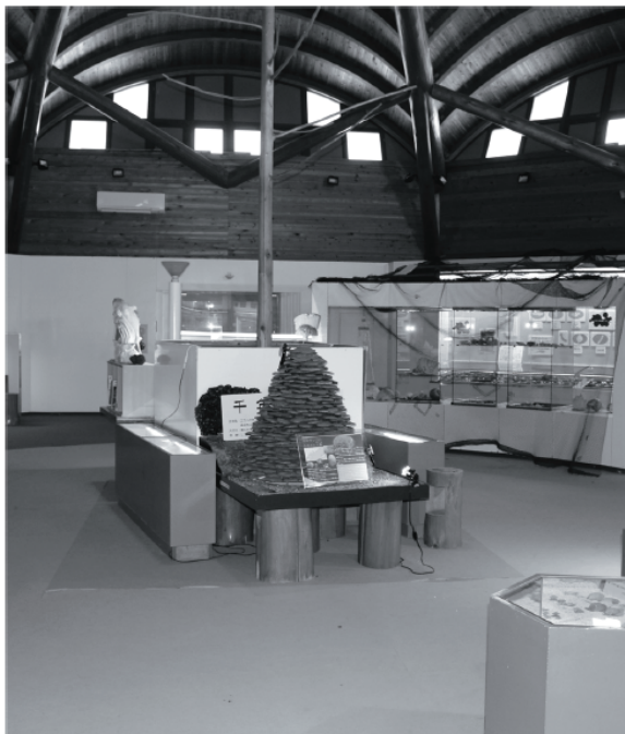
現在のモラスコむぎ「展示室」

出羽島が重伝建に選定され、出羽島を中心に観光客が町全域に広がる取り組みをしたい。