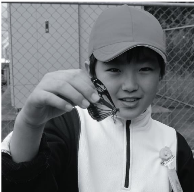
昨年10月に小学校に飛来したアサギマダラ