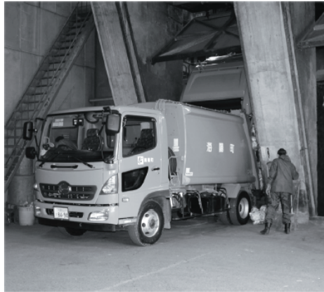
美化センターへのゴミ搬入作業

37年間の操業で周囲の自然環境・生活環境が良くなったのか悪くなったのかと問われれば、悪くなったと考えるのが普通であり、住民の皆さんが、子や孫の代までの操業は止めて欲しいと願うのは当たり前である。廃熱利用の銭湯や温水プールという一見新しい発想・アイデアのようには思われるが、時代遅れと言わざるを得ない。熱源にするゴミは減り続けており、数十年先を見通せばゴ