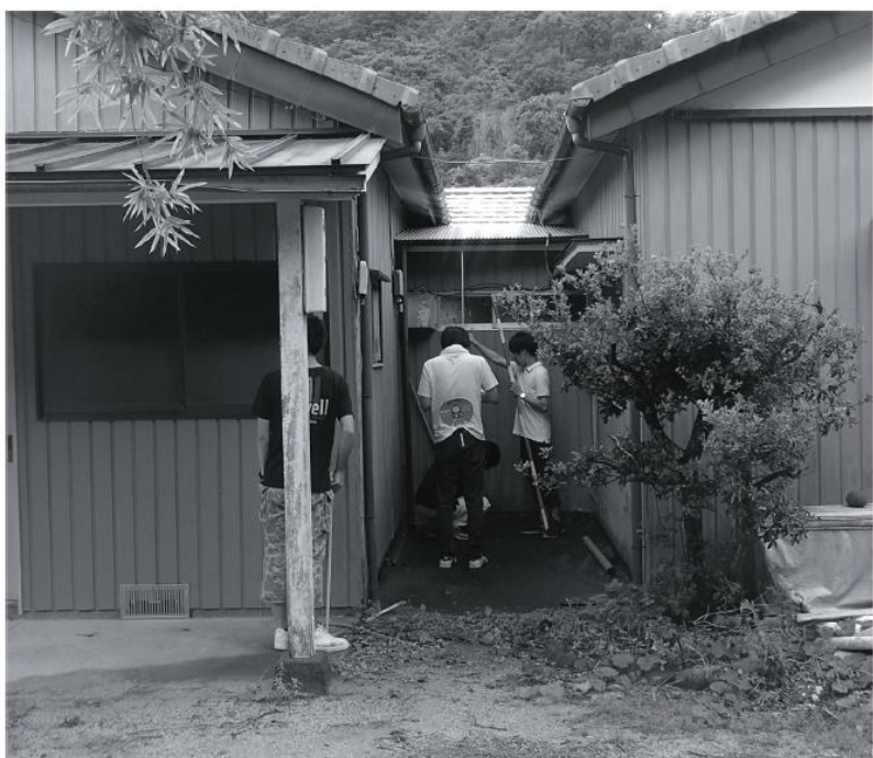
徳島大学建築サークル「アウト」の学生による船戸荘の利活用を考えるための現地調査

学校や病院のように、なくてはならないものはしっかりと維持し、暮らしがより便利になるものは住民と相談し進め、新しく始める