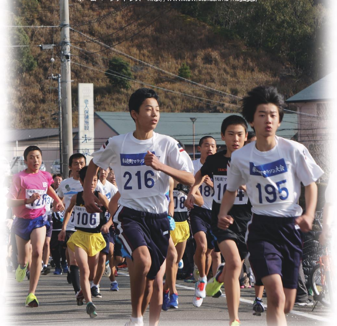
第40回牟岐町マラソン大会 平成28年12月18日

●発行 牟岐町議会・牟岐町役場 ●編集 広報委員会 TEL.72-1111(代) ●印刷 木村プリントテック ホームページアドレス http://www.town.tokushima-mugi.lg.jp/