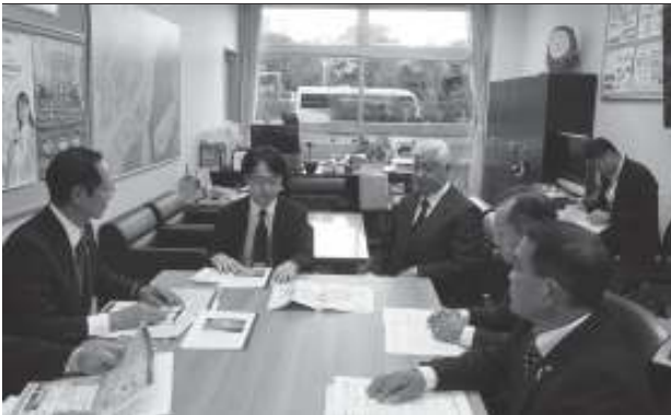
国土交通省 沓掛敏夫 道路局長へ要望