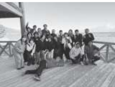
令和8年1月2日開催 (昭和53年度生まれ)