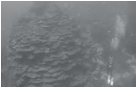
世界最大級、最長寿の可能性のある千年サンゴ