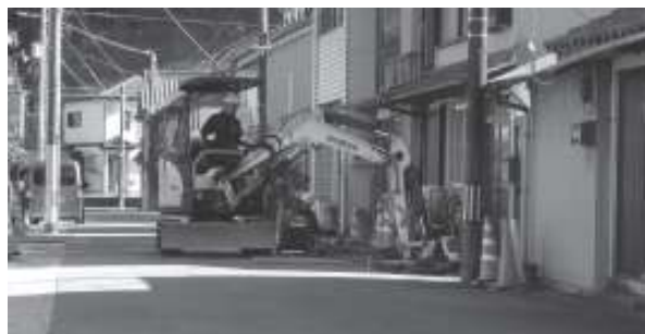
側溝蓋を全てコンクリート蓋から10m間隔でグレーチングへ変更、埋め戻し材を土砂から碎石へ変更、残土処理費の追加