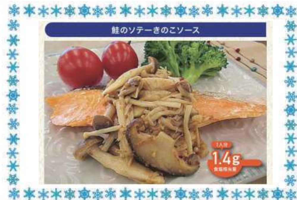
鮭のソテーきのごソース