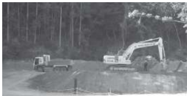
新庁舎と牟岐港の浚渫土の受け入れ残土の増加による敷き均しと締め固めを行うための追加

八坂残土処理場整備工事(追加)150万円 町道東本町線改良工事(追加)100万円