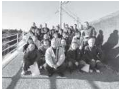
令和8年1月2日開催 (昭和45年度生まれ)