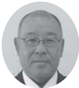
みずた たけし 議員