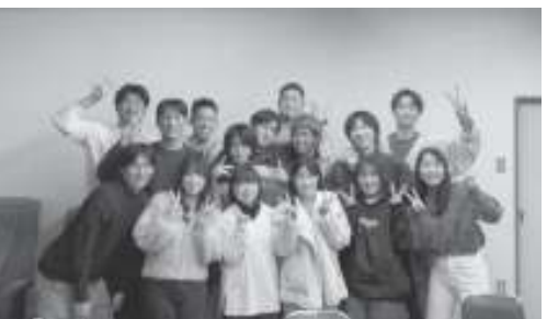
令和8年1月1日開催 (平成14年度生まれ)

同窓会への助成制度についての相談をお待ちしています。 問い合わせ先：企画政策課 TEL0884-72-3420