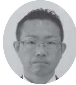
津田 修一 議員