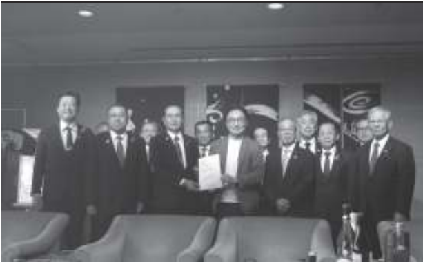
後藤田正純 徳島県知事へ要望書手交