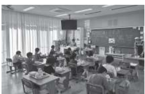
給食の様子(牟岐小学校1年生)

月1日より行っている。 ②小中学校の給食費の完全無償化については、現在、国において、具体的な制度設計が本格的に進められているところなので、国の動向を注視し、国の発表に対し柔軟に対応できるように検討する。