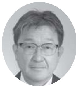
ますとみ おさむ 町長

総務課関係では、10月24日に徳島県総合防災訓練が開催され、海上保安庁のヘリによる広域避難訓練に参加しました。10月26日には地震津波避難訓練を実施し、820人の参加がありました。デジタル推進課関係では、牟岐町公式LINEに単身者見守り機能を追加し、家族がLINEを利用して、高齢者の安否確認が出来るようになりました。税務会計課関係では、定額減税不足額を、239名に、総額570万円給付しております。