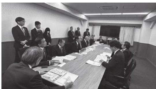
海部郡安芸郡議長連合会による道路整備要望財務省(令和7年11月11日)