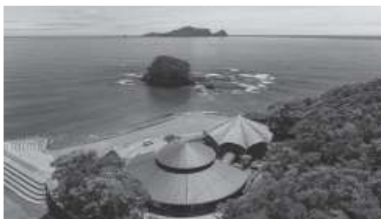
上空からの「モラスコむぎ」

令和6年度牟岐町B&G海洋センタープール大規模修繕工事について、変更工事請負契約を締結するため議会の議決を求めるもの。 (原案可決)