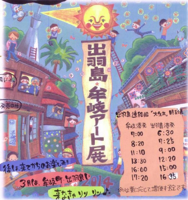
出羽島連絡船「大生丸」時刻表